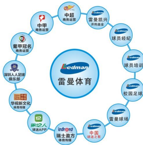
雷曼体育战略布局图

的布局步伐。公司在足球产业链上下游进行了多方位布局，并且开启了海外战略，构建纵深化与国际化的体育版图。